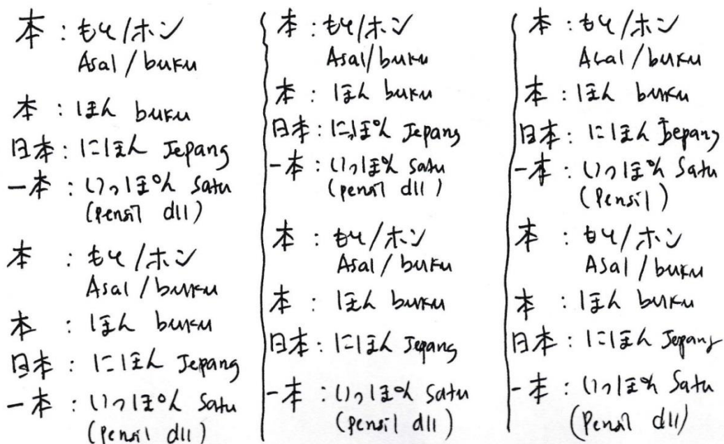
Gambar 5. Latihan Kanji “本” diikuti cara baca, arti gabungan antar kanji dan artinya